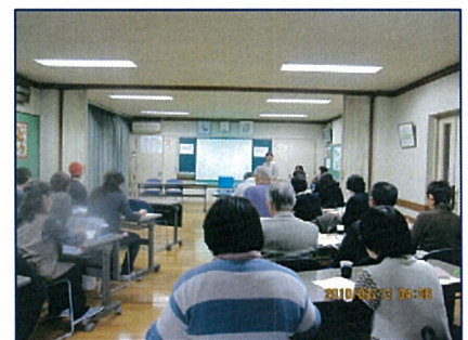
認知症サポーター養成講座

さて、サポートすると言っても、認知症がどんな病気なのかを知らなければ、サポートのしようがありません。 そこで、永田地域包括支援センターや区役所、区社協と相談しながら「認知症サポーター養成講座」を開催し、地域住民に認知症について正しく理解してもらう機会を設けました。 この講座を受けた方には、地域で認知症の方を見かけた際のさりげない見守りをお願いしました。