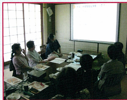
熱心に画面を見つめる皆さん

地区社協が生まれた歴史的背景から、何を目的としてどのような組織体制で活動を進めるとうまくいくのか? など様々な素朴な疑問を解決するための研修会となりました。