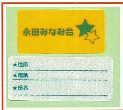
あんしんオレンジシール

左の写真のシールは「あんしんオレンジシール」と言います。 永田みなみ台地区の高齢者に配布するために作成しました。 オレンジのシールは靴のかかとやいつも持ち歩くバック、杖などに貼ります。蛍光色なので夜間も安心です。 白いシールは氏名や連絡先を記入して、靴の内側やバックの内側などに貼ります。 自分の持ち物が探しやすくなるとともに、認知症の方にとっては道に迷って帰れなくなった時などに、すぐに身元がわかるようになります。このシールの普及によって、高齢者を地域で見守り、何かあった時に身元がわかることで対応がしやすくなります。