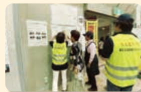
地域防災拠点の確認

発災時に災害ボランティアセンター設置・運営がスムーズに行えるように、平常時は災害ボランティアセンター設置訓練、研修、区民への啓発活動、他団体とのネットワークづくり等を行っています。