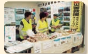
東北復興応援販売