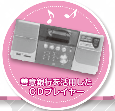
善意銀行を活用した CDプレイヤー

自立支援の会「グループねこの手」には、多くの方がそれぞれに楽しめる雰囲気の中、居心地の良いゆったりした時間が流れていました。