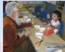
◆科学おもちゃ工作◆

手話コーラス・ミニ手話講座・点字体験・ ハンディキャブ乗車・木のおもちゃづくり・おもちゃ病院・ アイマスク体験・ボランティア犬とのふれあい 等