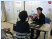
◆マジックミニ講座◆