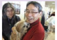
◆動物とのふれあい◆