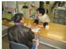
◆ボランティア登録・相談◆

パネル展示 ボランティア登録受付・相談 ちょっとボランティアはじめ ケアプラザでのボランティア紹介 等