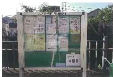
リニューアルした掲示板