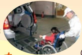
★ハンディ キャブ乗車