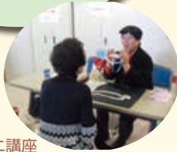
★マジックミニ講座