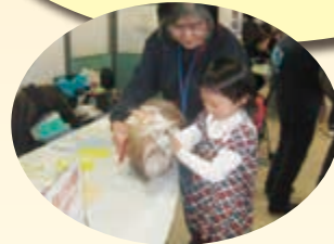
★動物との ふれあい